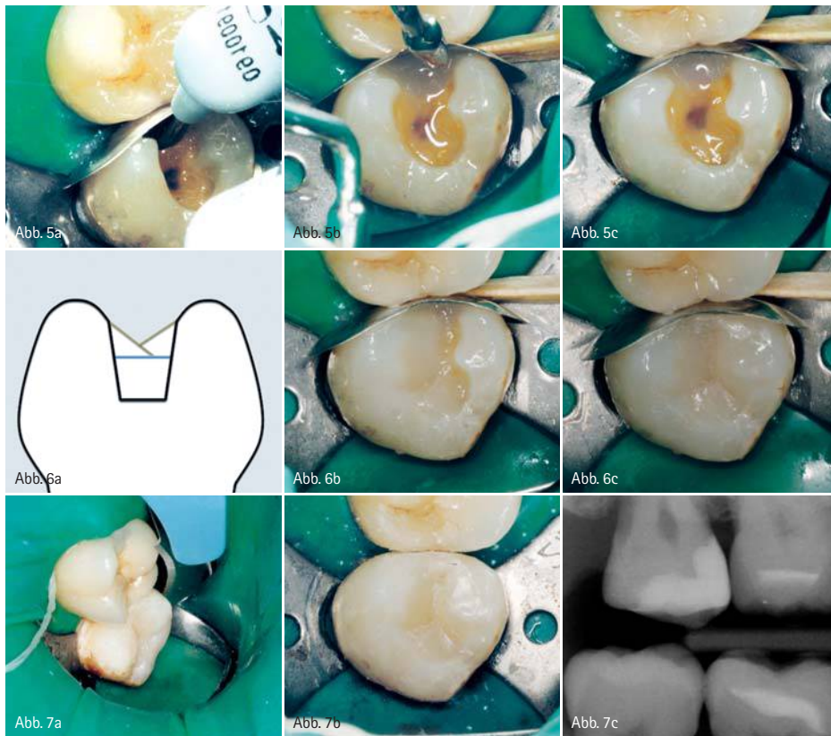
Abb. 5a: Die Applikatortspitze wird an den am weitesten mesial gelegenen Punkt der Kavität gebracht, damit das Material unter dem Einfluss der Schwerkraft eine gleichmäßige Schicht bilden kann. – Abb. 5b: Während SDR eine gleichmäßige Schicht ausbildet, wird die Matrice fest an den Nachbarzahn angedrückt, um einen strammen Kontaktpunkt zu erzeugen. – Abb. 5c: Gleichmäßige SDR-Schicht nach der Polymerisation. – Abb. 6a: Schematische Darstellung des Restaurationsverfahrens. Über einer Schicht SDR werden zwei Schichten mit herkömmlichem Komposit angelegt. – Abb. 6b: Die erste Schicht reicht von den palatinalen Höckern bis zum SDR-Sockel. – Abb. 6c: Die zweite Schicht reicht von den bukkalen Höckern bis zur ersten Kompositenschicht. – Abb. 7a: Kompositüberschüsse werden mit einem Skalpell entfernt. – Abb. 7b: Die Restauration nach Politur mit einem Occlbrush. – Abb. 7c: Röntgendarstellung des Endergebnisses.

onsstress zu kompensieren. Im hier vorgestellten Fall haben wir mit einem neuen fließfähigen Kompositmaterial gearbeitet: SDR von DENTSPLY DeTrey. Durch den sehr geringen Schrumpungsstress kann SDR in Inkrementen von jeweils bis zu vier Millimeter Schichtstärke eingebracht werden. Wegen seiner geringen Viskosität und seinem selbstnivellierenden Verhalten fließt das Material an alle Kavitätenwände an und bildet eine einheitliche Schicht ohne Lufteinschlüsse. Nachdem der Patient eine lokale Infiltrationsanästhesie erhalten hatte, wurden die Zähne 18 und 17 mittels Kofferdam absolut trocken gelegt, um optimal vor Kontaminationen zu schützen (Abb. 2). Die alte Restauration wurde entfernt und die Kavität präpariert, um sämtliches erkranktes Gewebe zu entfernen, zur Überprüfung wurde Kariesdetektor verwendet (Abb. 3). Nach dem Exkavie-